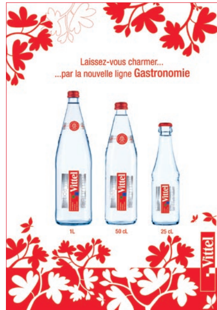
▲ Annonce magazine